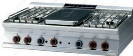
TP4T = 712 G/P

Věříme, že nabídnutá technická řešení Vám opět rozšíří možnosti využití našich kuchyňských linek v každodenním gastronomickém životě.