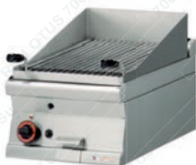
GWT = 74 G