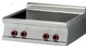
PGIT = 73 ET