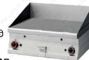
FTLT 76 G