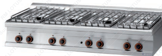
PGT = 716 G/P