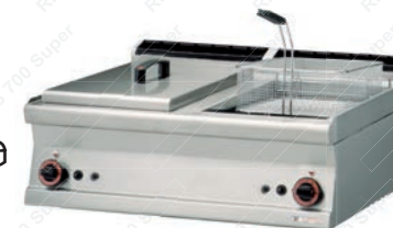
F2H3T = 73 G